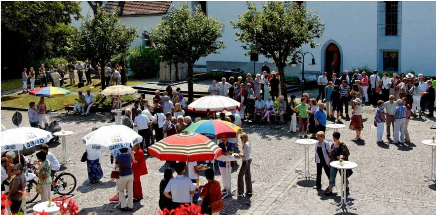
Begegnungen, Gespräche, Musik nach dem ökumenischen Gottesdienst am 18. Juli